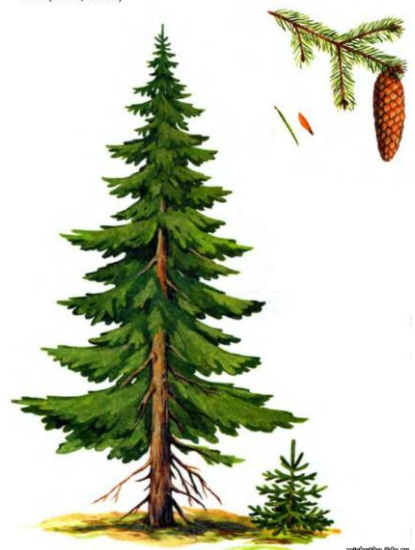
Ель (лето, зима)

4). Поиграйте с ребенком в игру: «Посчитай»